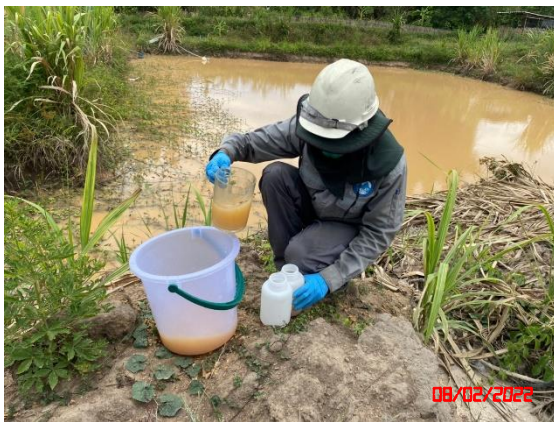
บ่อดักตะกอน บ2