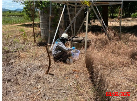
บ่อน้ำต้นวัดโป่งรี