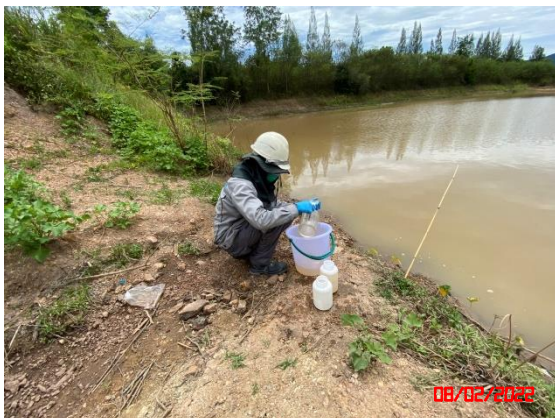
สระน้ำขุดใหม่ด้านทิศตะวันตกของพื้นที่โครงการ