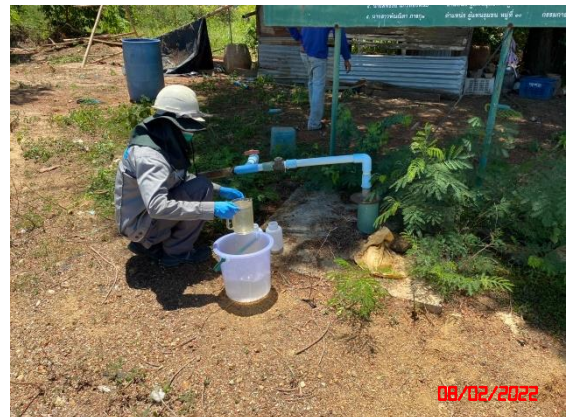
บ่อน้ำตื้นบ้านโป่งรี