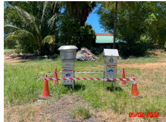
บ้านโป่งรี (หลังที่ใกล้โครงการมากที่สุด)