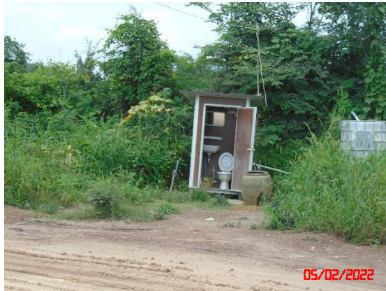
รูปที่ 2-13 พื้นที่หน้าเหมืองปัจจุบัน