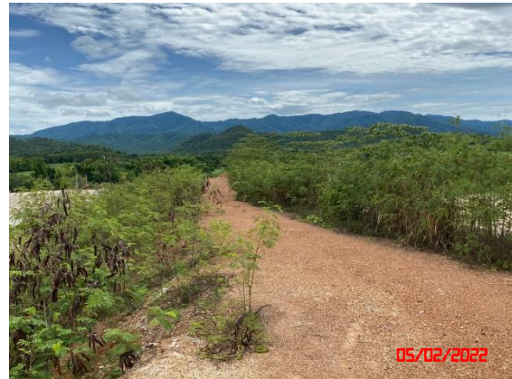
รูปที่ 2-7 แนวต้นไม้บริเวณรอบพื้นที่โครงการ