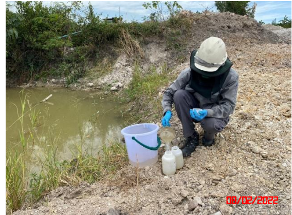
บ่อดักตะกอน บ1