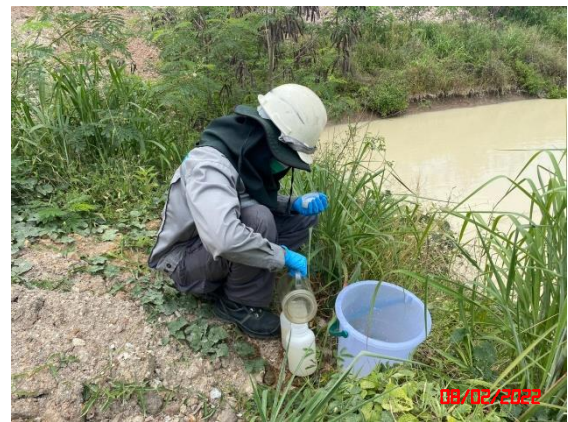
บ่อดักตะกอน บ3