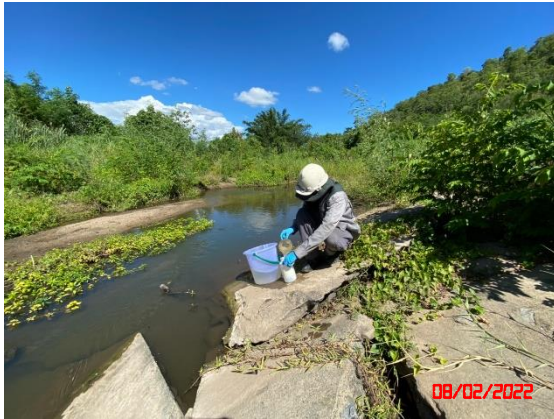
ฝายน้ำบ้านหนองแกใน