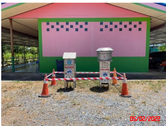
โรงเรียนบ้านหนองแกใน