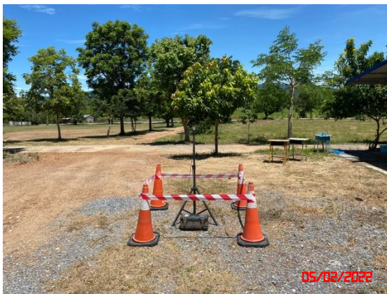
โรงเรียนบ้านหนองแกใน