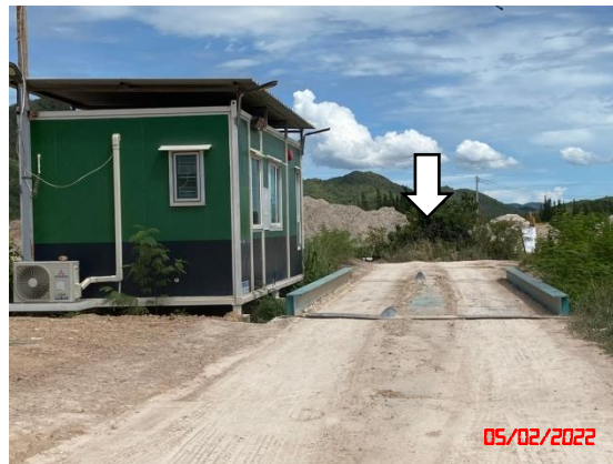
รูปที่ 2-18 การตรวจวัดคุณภาพอากาศ ระหว่างวันที่ 5-8 กุมภาพันธ์ 2565