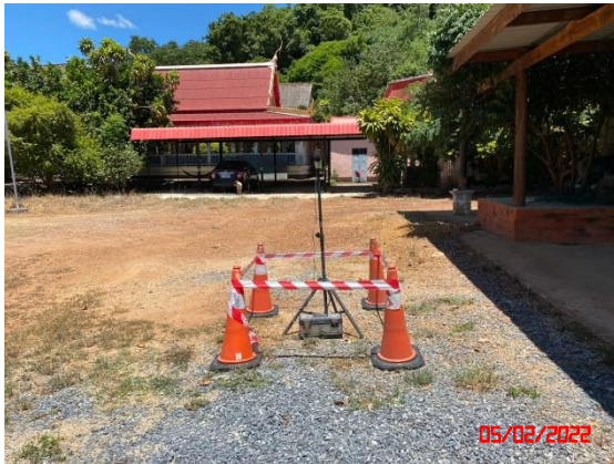
วัดโป่งรี (เทพประทานพร)