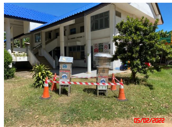
โรงพยาบาลส่งเสริมสุขภาพตำบลบ้านลำอิฐ