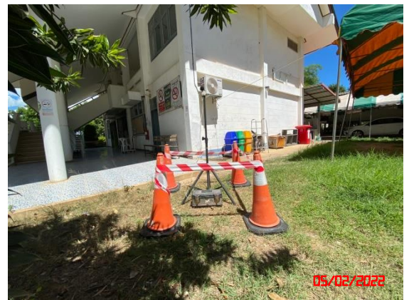
โรงพยาบาลส่งเสริมสุขภาพตำบลบ้านลำอิฐ