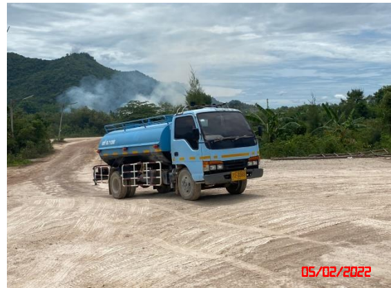
รูปที่ 2-16 ปิมน้ำบริเวณบ่อดักตะกอน