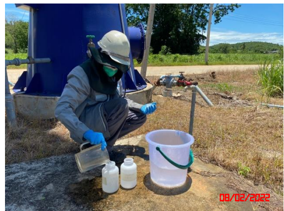
บ่อบาดาลบ้านโป่งรี