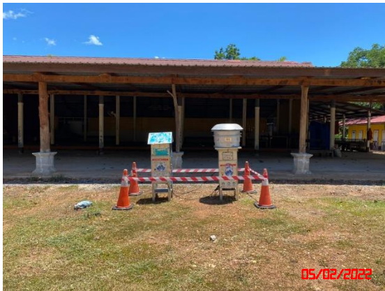
วัดโป่งรี (เทพประทานพร)