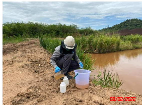
สระน้ำด้านทิศใต้ของพื้นที่โครงการ