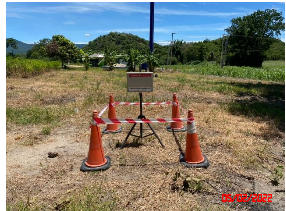
บ้านโป่งรี (หลังที่ใกล้โครงการมากที่สุด)